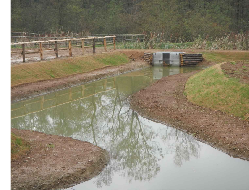
Esempi bacini di affinamento