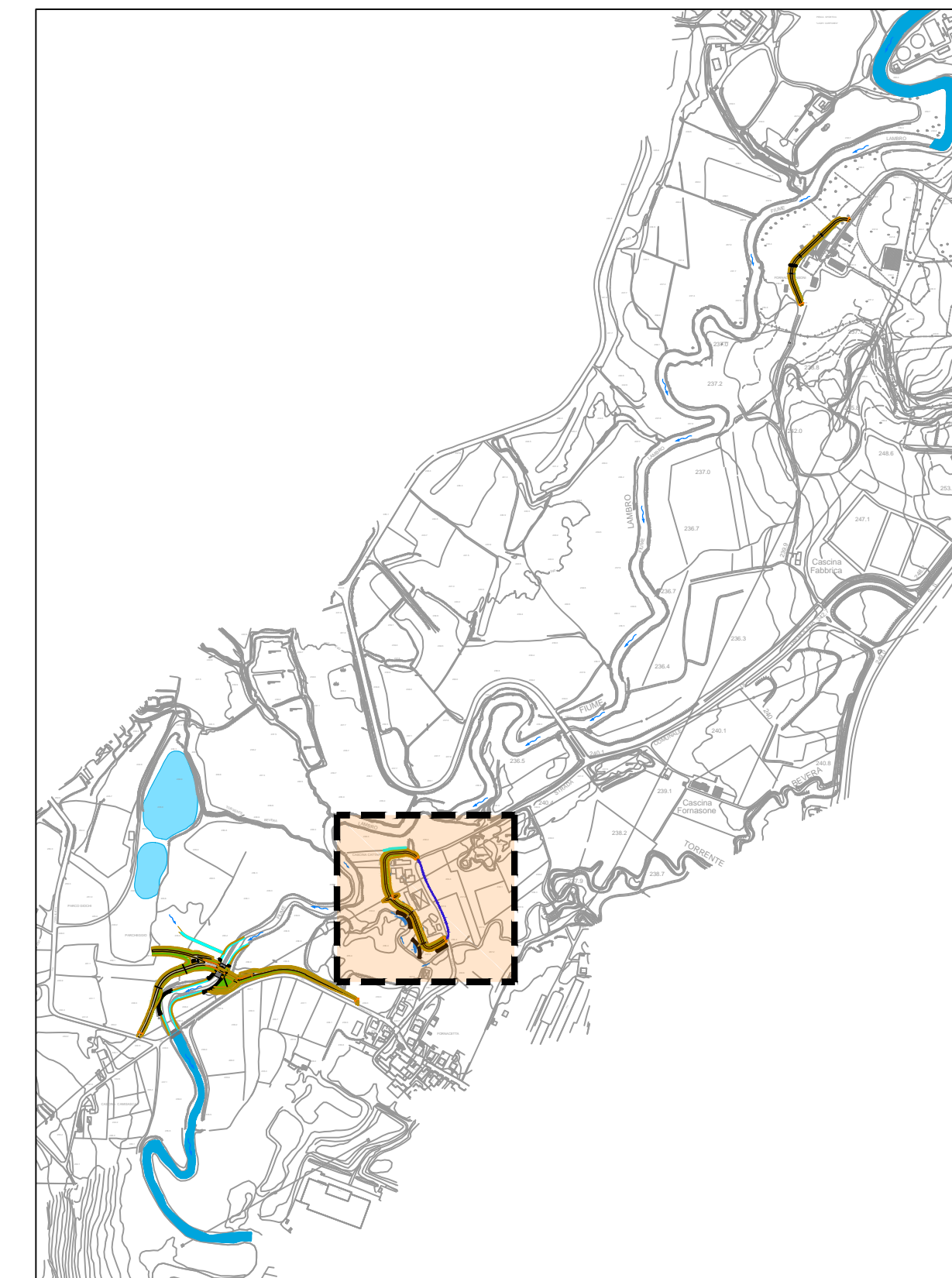
INQUADRAMENTO GENERALE - SCALA 1:10.000